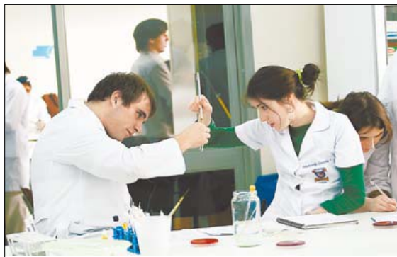
Varios campos clínicos componen la docencia de Medicina en Usach.

cuya preparación les permite desempeñarse en la atención primaria de salud y en el área hospitalaria del sector público. Es por ello que procuramos una alta calidad docente, calidad que se