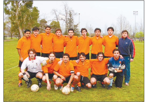
Selección de fútbol de la Universidad de Santiago de Chile.

La selección de fútbol de la Universidad de Santiago de Chile,