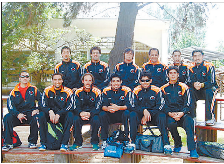
Selección de vóleybol. Vicecampeones "Nacional Universitario".

Las selecciones de fútbol, vóleybol damas y varones, karate, tenis de mesa y básquetbol damas, durante este año, han tenido una brillante participación en todos los torneos deportivos en que han participado.