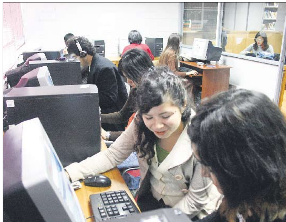
Las Becas Puntaje Nacional Usach son muy apetecidas por los futuros estudiantes.

Durante el proceso de admisión 2010, esta casa de estudios superiores otorgará, por ejemplo, hasta un máximo de 10 Becas Puntaje Nacional Usach.