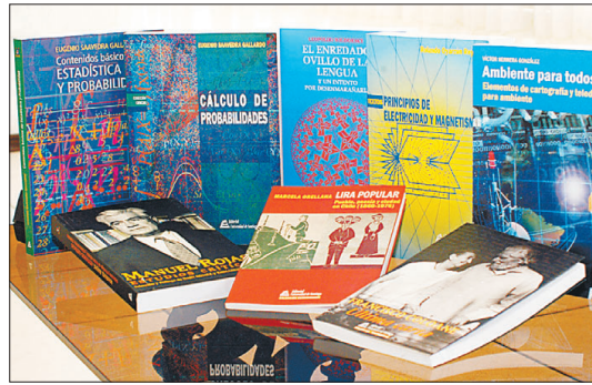
Todos los libros editados se encuentran a la venta en librerías.

Por otro lado, el Sello Editorial Usach ha tenido la constante preocupación de intensificar contacto con editoriales, distribuidores, organismos gubernamentales y gremios profesionales, tanto nacionales como extranjeros, en la búsqueda de material para sus publicaciones y coediciones como también de estrategias de venta. Además, el sello es socio de la Cámara Chilena del Libro y participa, permanentemente, en ferias, exposiciones y eventos ligados al área, que se realizan en Chile y en el extranjero. A través de variadas acciones, el Sello Editorial busca acercar el libro a los alumnos y al público en general, y