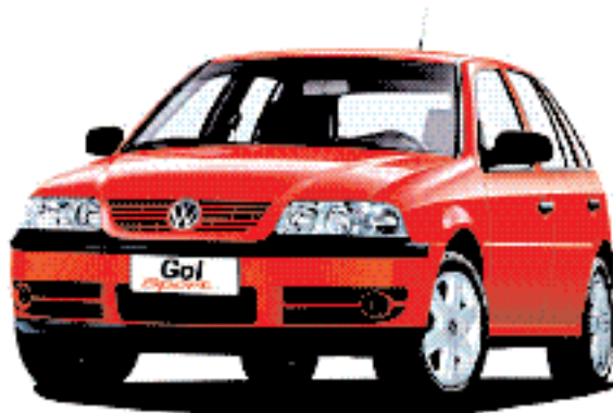
Volkswagen Gol Sport

Busca la pregunta del día que se publica de lunes a domingo en el cuerpo C de El Mercurio o busca las preguntas en EMOL. Envía un mensaje de texto desde tu teléfono móvil al número 4556 (*), digitando el número de la pregunta y la letra de la alternativa correcta (ej. 1A), y participarás mensualmente en el sorteo de espectaculares premios: