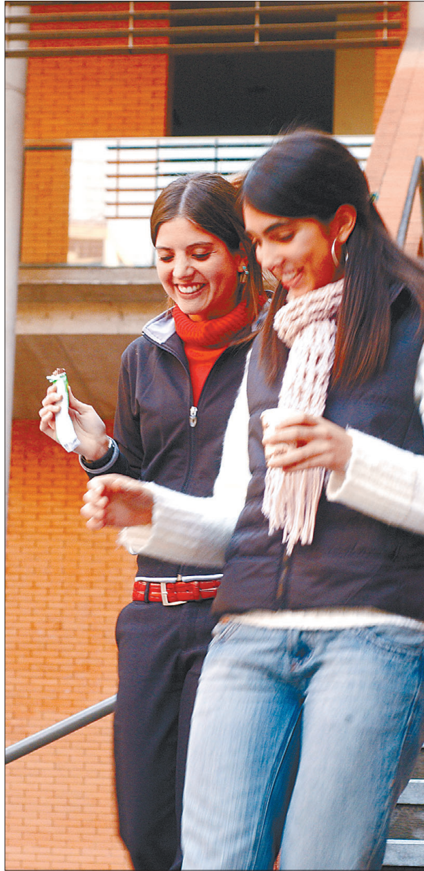
E) Cartelera cinematográfica.